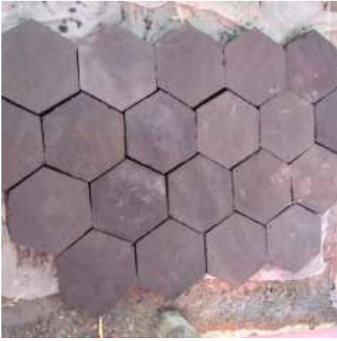
Het resultaat. 30 plavuizen per m2.