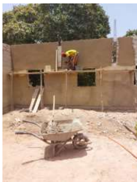
De muren worden afgesmeerd.