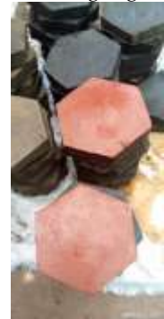
Grond nivelleren. Plavuizen leggen, Met een mengsel van zand en cement inwassen. 1 e gekleurde tegels.

De werkelijke kosten bedroegen € 3.480. Dat is € 363 meer dan de geraamde kosten (€ 3.117). Dat kwam vooral doordat de prijs van de taf taf was gestegen.