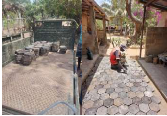
Levering bij klant waar de plavuizen op verzoek worden gelegd.